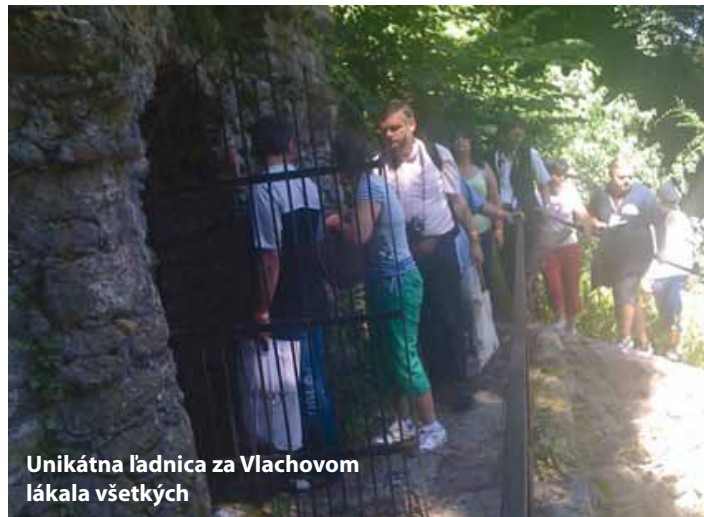
Unikátna ľadnica za Vlachovom lákala všetkých

Vlachovčania si rovnako ako Gočovčania cenia svoju kultúru a históriu (ale aj turistov a turistické návštevy!) a tak prehliadka vlachovskej baníckej histórie bola vzrušujúcim spoznávaním zvykov,