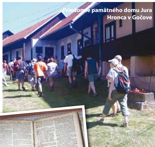
Priedomie pamätného domu Jura Hronca v Gočove

Gočovčania sú milí ľudia a i napriek tomu, že náš sprievod