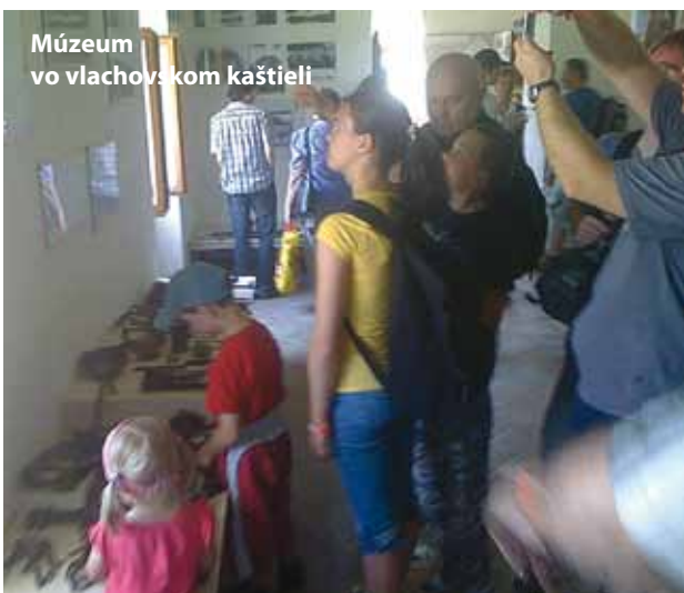
Múzeum vo vlachovskom kaštieli

ná. Po Betliari sme nakrátko zastali v obciach Gemerská Poloma a následne aj v začadenej Nižnej Slanej, ktorej za chrbtom sídli opustená hrdzavá gigantická fabrika – spomínaný Siderit. I keď nás v Nižnej Slanej privítal skutočný výpravca (netušíme čo na trati reálne vypravuje : ) ), na týchto staniaciach sa podpísal zub času a ruky vandalov. Vytĺčené okná, rozbité staničné nápisy, zarastené železničné stavby... Niektoré budovy odkúpili súkromní vlastníci avšak tie, ktoré to šťastie nemali, smutne puštnú ako memento a spomienka na kedysi hojne využívanú trať. Po krátkom fototermíne a dostúpení niekoľkých