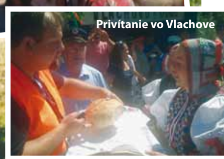
Na jazde naprieč horným Gemerom sa zúčastnili malí aj veľkí